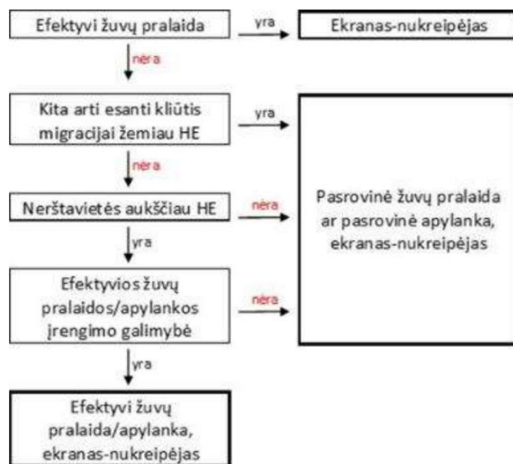
Priemonių parinkimo schema

Prioritetinė siekiama priemonė užtvankoms su hidroelektrinėmis būtų užtvankų demontavimas, jeigu HE savininkai planuotų artimoje ateityje nutraukti elektros gamybą, arba nesilaikytų teisės aktuose nustatytų aplinkosauginių reikalavimų ar nevykdytų UBR valdymo planuose atitinkamoms HE numatytų priemonių. Kol informacijos apie HE savininkų ketinimus neturima, priemonės buvo siūlomos vadovaujantis Studijoje pasiūlytu algoritmu pagal tokią schemą: